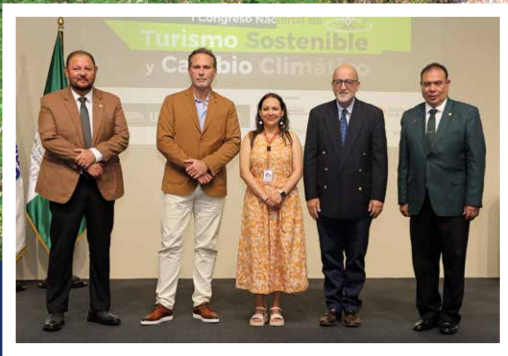
I Congreso Nacional de Turismo Sostenible y Cambio Climático p. 4