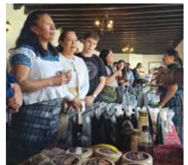
Hotel Escuela en Sololá p. 9