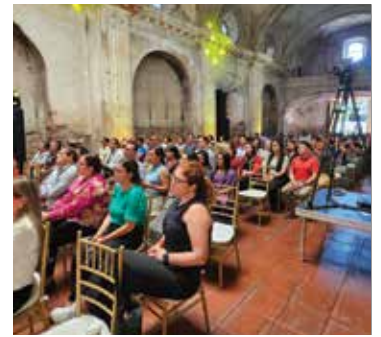
REMOTE Immersion Antigua p. 7